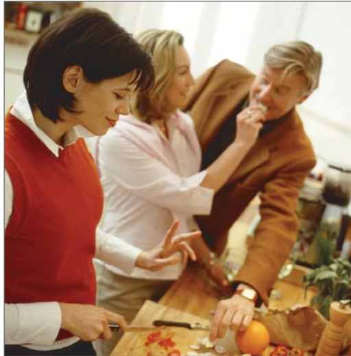
Der erste Schritt: Genussvoll Essen

Stellen sich jedoch Magen-Darm-Beschwerden wie Völlegefühl, Blähungen, Sodbrennen oder Durchfall ein, fühlen wir uns unwohl und möchten diese lästigen Quälgeister möglichst schnell und ohne Aufsehen beseitigen.