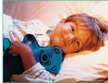
Manchmal hilft schon eine Wärmflasche

helfen im Allgemeinen Hausmittel wie Tees, eine Wärmflasche und natürliche Mittel bei Völlegefühl, Blähungen, Durchfall und Verstopfung.