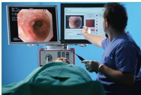
Untersuchung der Speiseröhre

Länger anhaltende Symptome sollten ernst genommen und ärztlich behandelt werden. Denn es könnten sich Geschwüre bilden wie auch Narben, die die Speiseröhre verengen.