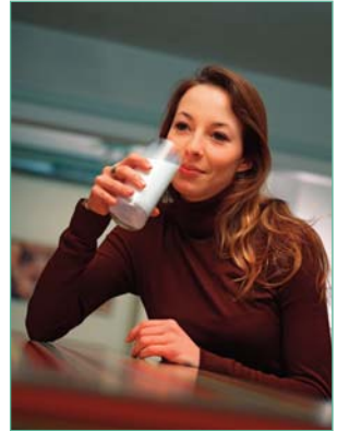
Bei Milchzuckerunverträglichkeit lieber Laktose-freie Milch genießen

Eine häufige Ursache sind das Reizdarmsyndrom und die Laktoseintoleranz (Unverträglichkeit von Milchzucker).